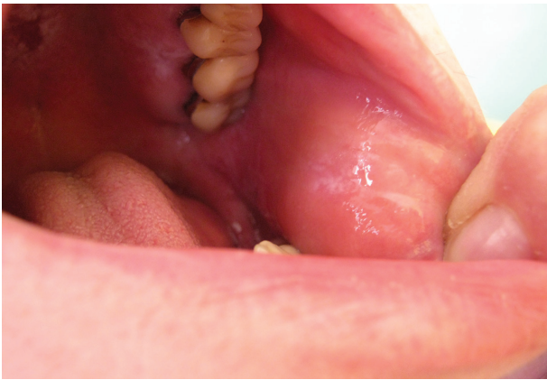
Obr. 9. Alergická kontaktní stomatitida lichenoidního typu v dutině ústní po amalgámu