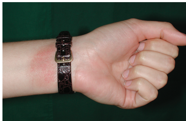
Obr. 7. Alergická kontaktní dermatitida na soli niklu

Projevy AKD korespondují s místem kontaktu alergenu s kůží (primární lokalizace), bývají nejčastěji na