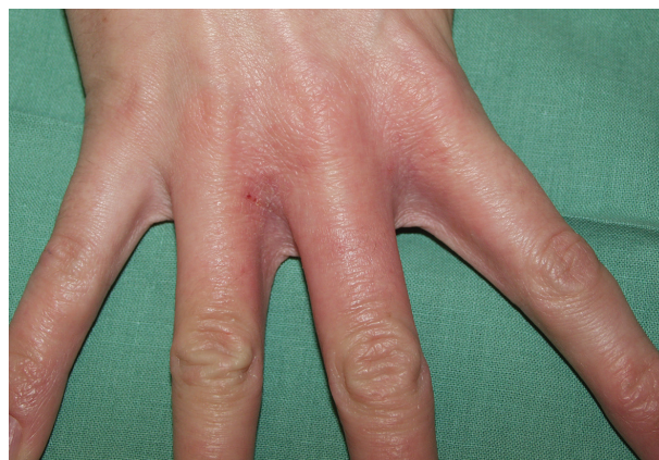
Obr. 1. Iritací reakce v meziprstí rukou („mokrý práce“, saponáty)

2. Iritací reakce – na kůži zjišťujeme mírné známky zánětu (suchost, diskrétní olupování, zarudnutí). První