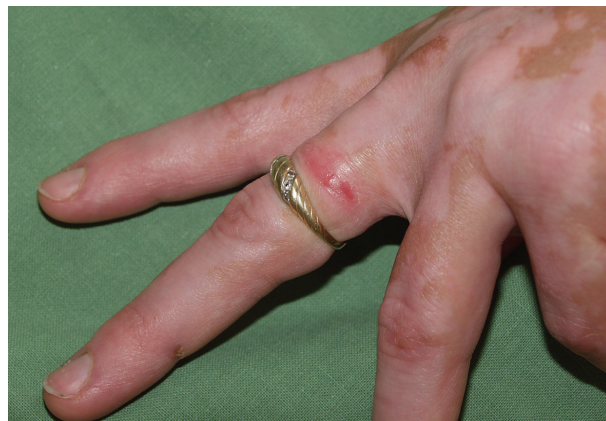
Obr. 2. Iritací reakce pod šperkem