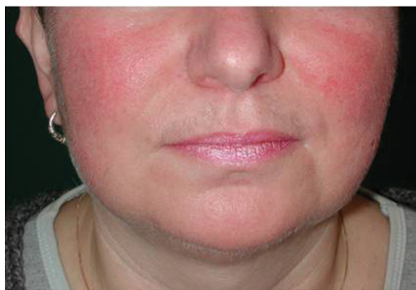
Obr. 6. Airborne iritační kontaktní dermatitida po persterilu

nemají typický „crescendo“ vývoj, během odečítání zeslabují nebo kompletně vymizí [14, 69].