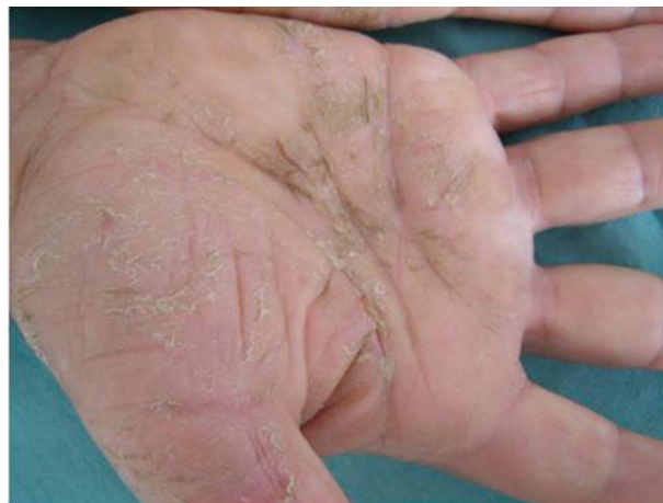
Obr. 5. Chronická iritační kontaktní dermatitida na dlaních po pracovních rukavicích