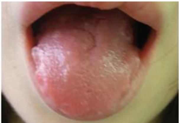
Obr. 10. Alergická kontaktní cheilitida granulomatózního typu po solích rtuti v amalgámu