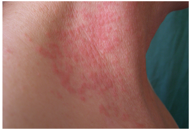
Obr. 11. Airborne alergická kontaktní dermatitida po kalafuně