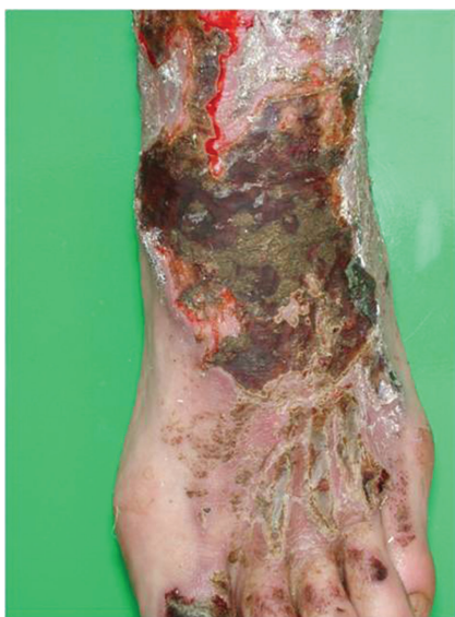
Obr. 4. Akutní iritační dermatitida po solích chromu (cauterisatio)

4. Opožděná akutní IKD – má podobné symptomy jako akutní IKD, klinicky viditelný erytém se objevuje po expozici opožděně (po 8–24 hodinách) a může imitovat alergickou kontaktní dermatitidu. Typickými vyvolavateli jsou bezalkonium chlorid, ditranol, etylenoxid. Tento typ reakce vidáme i během epikutánních testů, reakce