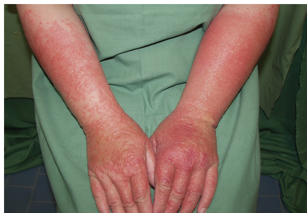
Obr. 8. Alergická kontaktní dermatitida po ketoprofenu