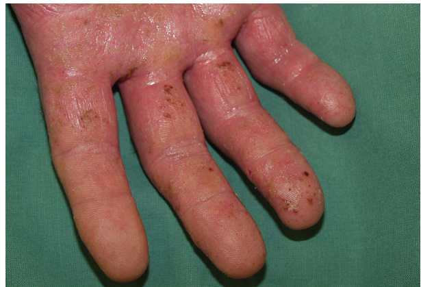
Obr. 12. Proteinová kontaktní dermatitida dysidrotického typu po bílkovině latexu

rukou, předloktích (obr. 7), na obličeji, ve výstřihu a na krku. Při přetrvávajícím kontaktu se alergen přenáší prsty, oděvem na místa vzdálenější (sekundární lokalizace). Projevy akutní dermatitidy zahrnují živě červené makuly, papuly či makulopapulky velikosti špendlíkové hlavičky, uspořádané do trsů či skupinek. Při vystupňované závažné reakci se objevují vezikuly, buly, mokvání, tvorba krust nebo šupin (obr. 8). Pro chronickou dermatitidu jsou typické červenohnědý erytém s/bez papulovezikul, deskvamace, hyperkeratózy, tvorba ragád a lichenifikace [27, 28, 39, 44, 59].