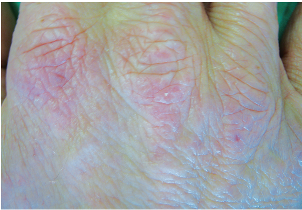
Obr. 13. Proteinová kontaktní dermatitida na hřbetech rukou po mase a koření u kuchaře

časný (I. typ) typ, u kterého hrají roli IgE a/nebo IgG receptory na žírných buňkách nebo IgE receptor na Langerhansových buňkách, ale i jiné mechanismy [21, 24, 39, 44].