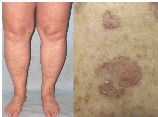
Obr. 7. Porokeratosis superficialis actinica disseminata