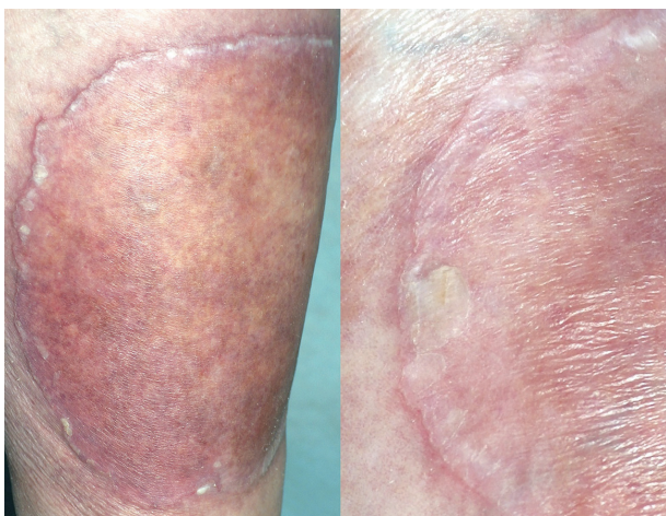
Obr. 3. Porokeratosis Mibelli gigantea V detailu s patrným tzv. periferním vláskovým lemem a atrofií kůže centrálně.