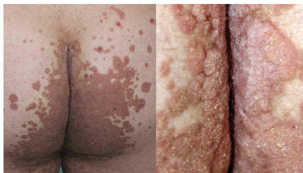
Obr. 5. Porokeratosis ptychotropica

PPPP je velmi vzácná forma PK, kterou poprvé popsal Brown v roce 1971 [12]. Označuje se také jako palmo-plantární keratodermie, punktátní typ II (PPKP2) [93]. Objevuje se obvykle po pubertě a v dospělosti. Projev dosahují velikosti pouze 1–4 mm, jsou mnohočetné a lokalizované na dlaních a chodidlech. Jednotlivé eflores-