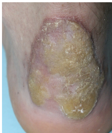
Obr. 2. Porokeratosis Mibelli

PM, první popsána PK, patří k druhé nejčastější formě s vyšším výskytem v mužské populaci [87]. Často se objevuje již v dětském věku. Začíná jako asymptomatická nebo mírně svědivá eflorescence, která se pomalu v průběhu let zvětšuje. Centrum bývá hypopigmentované nebo hyperpigmentované, atrofické, mírně se šupící, bez přítomnosti ochlupení (obr. 2). Někdy léze dosahují velikosti až 20 cm a tato forma je pak označována jako PM gigantea (obr. 3, 4). Některými autory je PM gigantea dokonce považována za samostatnou formu PK [41]. A může se vyskytnout současně s psoriázou [20]. PM je obvykle lokalizovaná unilaterálně na končetinách, někdy i na dlaních a ploskách, ve křtici, na genitálu či na rtu nebo na sliznici dutiny ústní. Při lokalizaci na prstu může projev zasahovat i nehtový aparát a způsobit pterygium [47, 62].