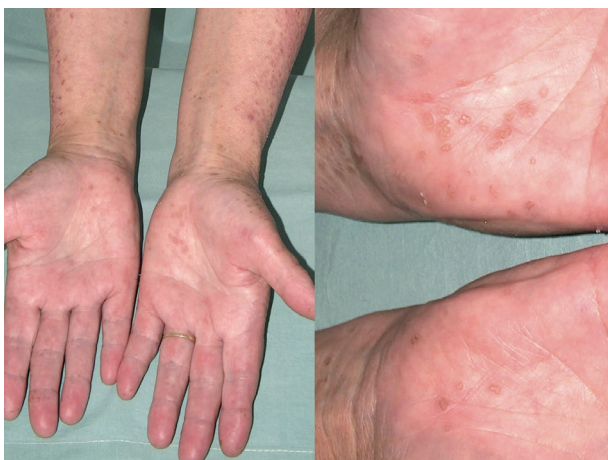
Obr. 8. Porokeratosis punctata palmaris et plantaris disseminata

V roce 1937 Andrew popsal novou klinickou variantu PK, provázenou mnohočetnými eflorescencemi lokalizovanými na trupu, genitálu, dlaních a na ploskách, kterou nazval DSP [5]. Tato forma PK je charakterizována drobnými červenými či hnědavými papulami s centrální atrofií objevujícími se obvykle kolem 5.–10. roku věku, ale i později, prakticky kdekoli na těle a může být provázena svěděním (obr. 8) [95]. Léze se mohou vyskytovat i na sliznici dutiny ústní [83]. DSP se častěji vyskytuje u transplantovaných, HIV pozitivních, či jinak imunosuprimovaných pacientů [87].