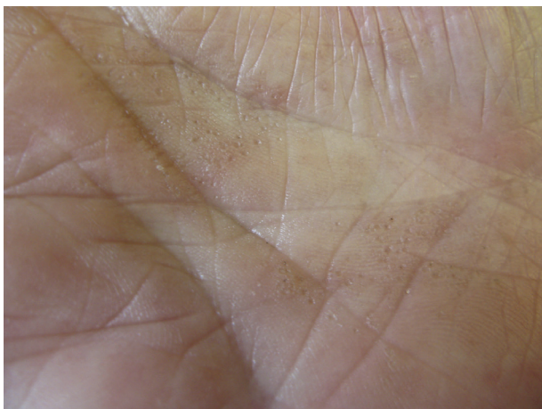
Obr. 4. Porokeratosis punctata palmaris et plantaris