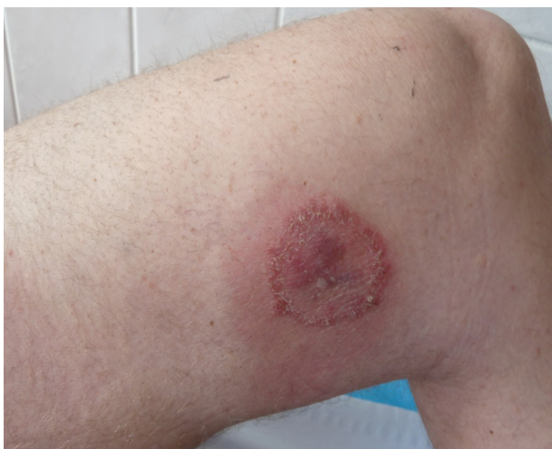
Obr. 2. Anulární ložisko s vyvýšeným okrajem

liv kontakt s infekčním onemocněním či zvířaty. Pacient byl nezaměstnaný a žil sám v nájemním bytě.