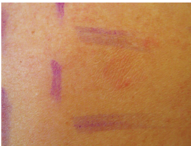
Obr. 6. Mýdlový efekt