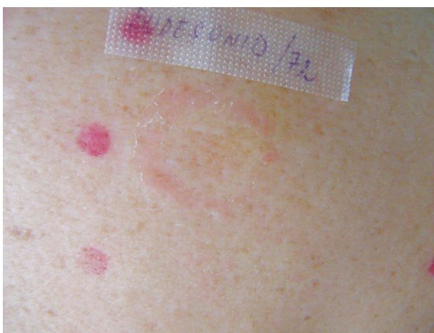
Obr. 7. Alergická reakce „edge“ charakteru