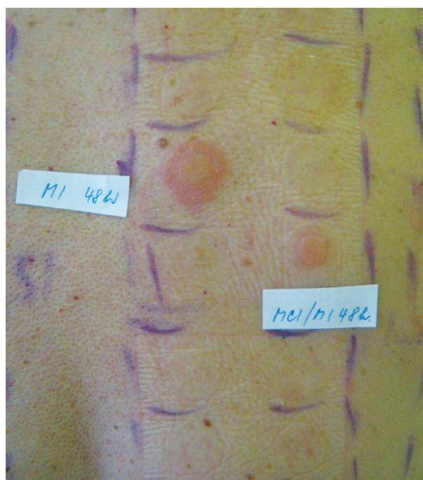
Obr. 15. Pozitivní epikutánní testy na isothiazolinony

barvy) a domácích přípravcích (přípravky na ošetřování kožených výrobků, aviváže apod.) limit není stanovený [2, 94]. Pryžové rukavice nechrání před penetrací MI [19]. Z malířských barev se uvolňuje řada týdnů (déle než 6 týdnů) a může být příčinou relapsů onemocnění [1, 49, 50]. MI byl nazván alergenem 21. století, alergenem roku 2013 v USA [91, 92] a KS na MI druhou epidemií na isothiazolinony [2, 23, 27, 78]. Kromě AKD ekzémového vzhledu (obr. 14, 15) vyvolává i kontaktní dermatitidu charakteru lymfomatoidní dermatitidy, vzhledu erytéma exsudativum multiforme, vyvolává airborne typ KD a systémovou KD (inhalací výparů) u senzibilizovaných osob včetně dětí, často zaměňovanou za recidivu atopické dermatitidy nebo lékový exantém [1, 39, 64, 97].