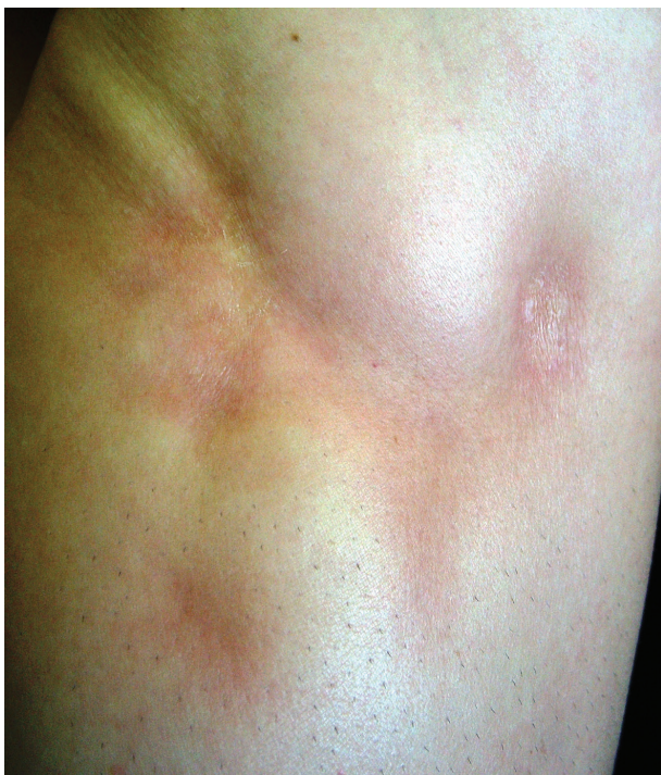
Obr. 11. Hluboká forma

ným funkčním, kosmetickým a psychologickým následkům s výskytem artralgií a artritid postižené končetiny asi u 30–50 % nemocných. Nejznámější je frontoparietální forma („en coup de sabre“) projevující se sklerotickým pruhem probíhající paramediálně na čele s přesahem do kštice, se vznikem jizvící alopecie, vzácně zasahující pod úroveň obočí, která může být spojena s poruchami centrálního nervového systému (kalcifikacemi falx cerebri, cefalgiemi, epileptickými záchvaty) a očními komplikacemi (uveitidou, episcleritidou, změnami adnex víček a poruchou jejich hybnosti) u 3,2 % nemocných dětí (obr. 9). U osob se změnami centrálního nervového systému a známkami aktivity choroby jsou proto doporučovány pravidelné oční kontroly v intervalu čtyř měsíců po prvních třech letech [56, 55].