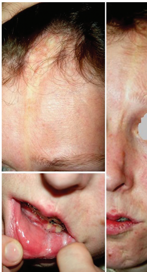
Obr. 9. Frontoparietální forma – „en coup de sabre“