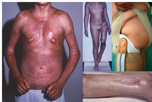
Obr. 5. Pansklerotická morfea

Eozinofilní fasciitida je onemocnění mnohými autory považované za formu generalizované LS [25], primárně postihující zánětlivým fibrotickým procesem fascii, případně podkožní tukovou tkáň, dermis a sval. Klinicky se projevuje náhlým vznikem bolestivých dolíčkujících symetrických otoků (zpravidla končetin, bez postižení rukou a nohou), které přechází v induraci. Retrakce fibrotizovaných vazivových sept podkožní tukové tkáně podmiňuje typický dolíčkovaný, „matracovitý“ vzhled (obr. 6) povrchu kůže v místech s větším tukovým polštářem (nejčastěji vnitřní strany paží, stehna). Laboratorně je provázena zvýšenou sedimentací krve, hypereozinofilií a hypergamaglobulinémií. Asi ve 30 % se nachází projevy ložiskové morfeje, které často vznikají před či po akutní fázi fascitidy [33].