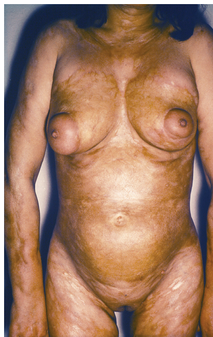
Obr. 4. Generalizovaná forma