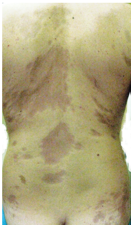
Obr. 3. Atrophoderma idiopathica Passini-Pierini

či mnohočetnými, symetrickými, ostře ohraničenými, šedohnědými, měkkými, někdy lehce vkleslými makulami, které jsou stejného vzhledu jako odeznělý projev morfeje (obr. 3).