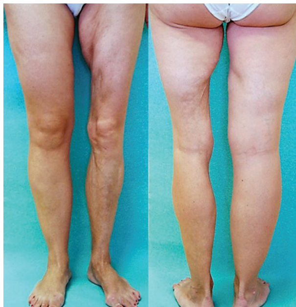
Obr. 8. Lineární forma se vznikem v dětství