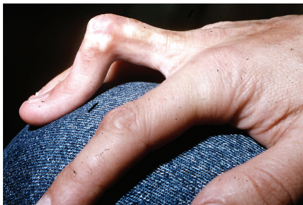
Obr. 7. Flekční kontraktura

Lineární LS je nejčastější formou u dětí [56]. Projevuje se jako pruhy tuhé kůže, nejčastěji na končetinách, které mohou sledovat Blaschkovy linie. V případě hlubokého postižení může vést v místech přemostujících klouby k flekčním kontrakturám (obr. 7), atrofii podkoží, případně svalů, a zpomalení růstu končetiny (obr. 8). U dětí má závažnější průběh než u dospělých a častěji vede k výraz-