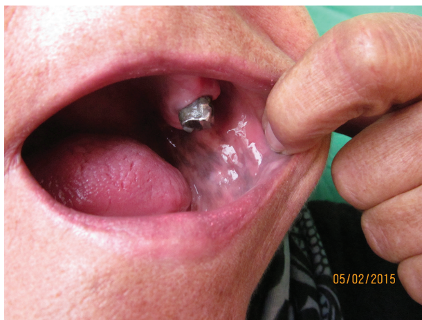
Obr. 1. Postižení sliznice dutiny ústní

i sourozenci a děti. V poslední době nepozorovala změny na kůži či sliznicích, ke stomatologovi chodí na kontroly pravidelně 2krát ročně. Cítí se dobře, sportuje a nemá žádné subjektivní potíže, nemá změnu výkonnosti, nebývá nemocná. Léková anamnéza i po cílených dotazech beze změn. Při důslednější aspekci bylo shledáno bronzové zbarvení celého kožního povrchu s intenzivnějším hnědým nádechem v solárních predilekcích a v oblastech nad kolena, lokty, v kožních záhybech a v papilárních liniích dlaní. Nehty, nehtová lůžka a jizvy byly bez patologického nálezu (obr. 3, 4).