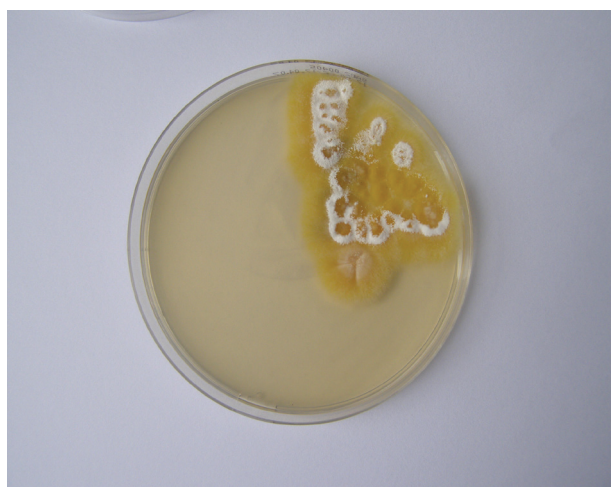
Obr. 3a. Masivní nález Arthroderma benhamiae na Sabouraudově agaru s chloramfenikolem

K léčbě infekcí způsobených Arthroderma benhamiae je doporučován na prvním místě terbinafin, alternativou