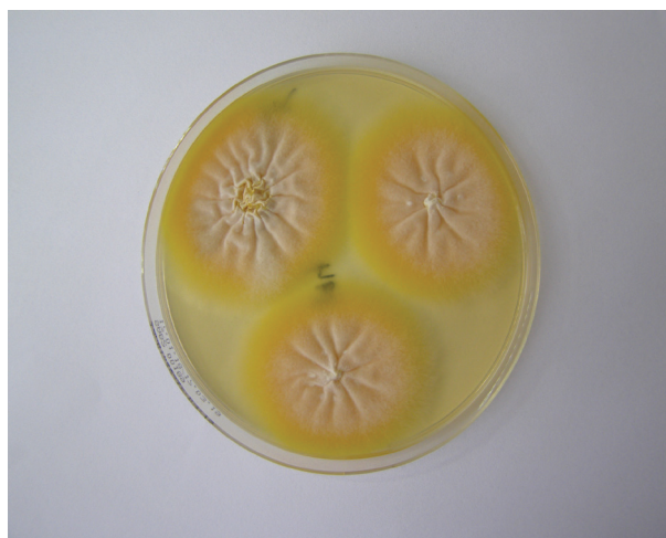
Obr. 3b. Masivní nález Arthroderma benhamiae na Sabouraudově agaru s chloramfenikolem