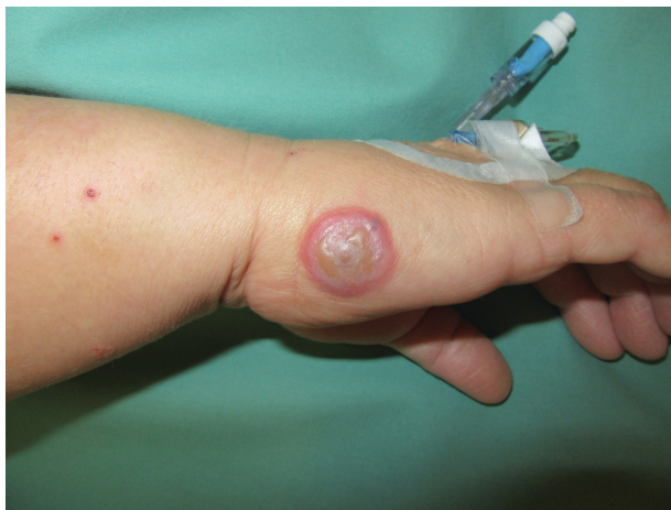
Obr. 1. Klinický obraz – dojičský hrbol na pravé ruce