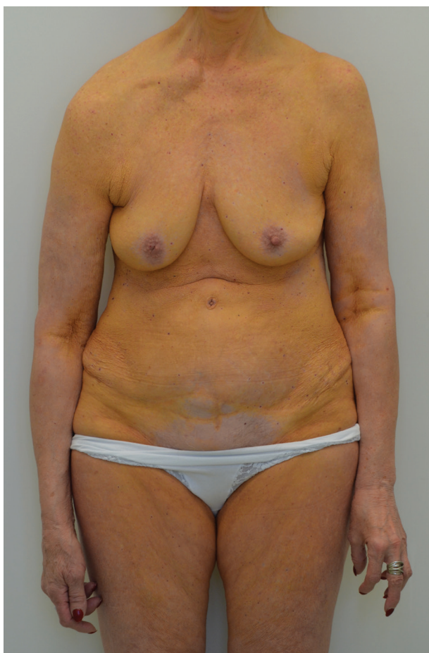
Obr. 1. Žlutooranžové zbarvení přední strany trupu a končetin (oblast areol a podbřišku bez postižení), luxace pravé klavikuly

Pacientka byla odeslána k novému přešetření na hematologii a po konzultaci s hematologem byla pro výraznou progresi kožního nálezu a symptomatický mnohočetný myelom zahájena protinádorová terapie. Od