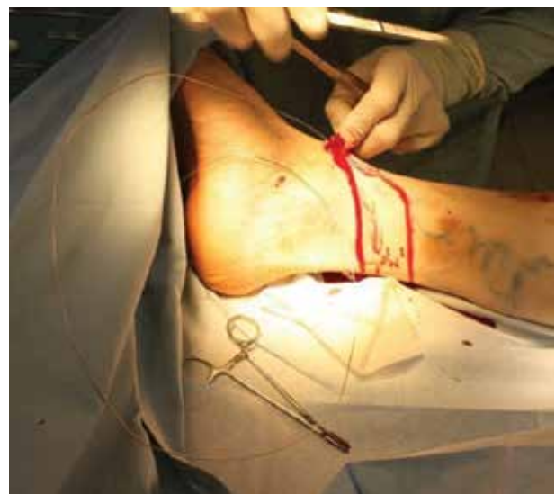
Obr. 6. Zavádění endostriptomu

Nejčastější komplikací je porušení senzitivní inervace – nervus saphenus (obvykle reverzibilní) a krvácení. Další nevýhodou je delší rekonvalescence. Mezi závažnější komplikace chirurgické intervence patří HŽT, plicní embolie (zřídka), tromboflebitida [19, 33, 51]. Výkon je prováděn v celkové, či svodné anestezii. Exstirpace se provádí speciálním nástrojem – endostriptomem (obr. 6). Snaha o limitovaný stripping z důvodu zachování žíly k revaskula-