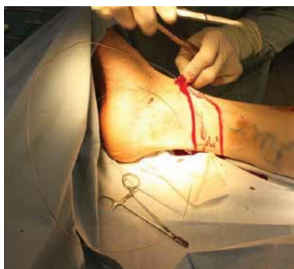
Obr. 6. Zavádění endostriptomu

Nejčastější komplikací je porušení senzitivní inervace – nervus saphenus (obvykle reverzibilní) a krvácení. Další nevýhodou je delší rekonvalescence. Mezi závažnější komplikace chirurgické intervence patří HŽT, plicní embolie (zřídka), tromboflebitida [19, 33, 51]. Výkon je prováděn v celkové, či svodné anestezii. Exstirpace se provádí speciálním nástrojem – endostriptomem (obr. 6). Snaha o limitovaný stripping z důvodu zachování žíly k revaskula-