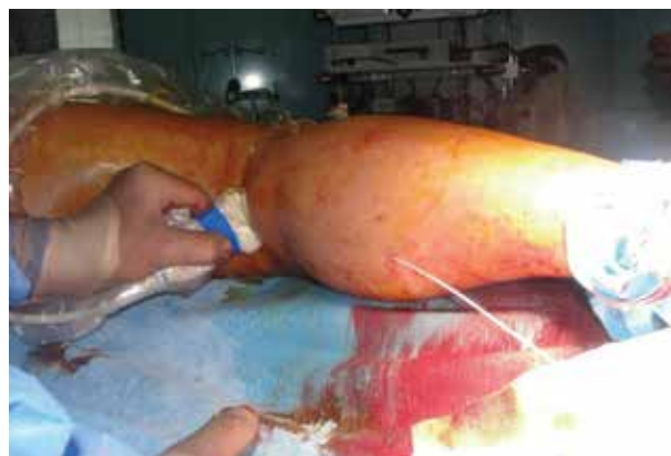
Obr. 8. Zavádění vlákna do vena saphena parva pod ultrazvukovou kontrolou

Laserové vlákno je zavedeno do žíly pod USG kontrolou precizně 1–2 cm od safenofemorální junkce. Následně lze pacienta uvést do Trendelenburgerovy polohy za