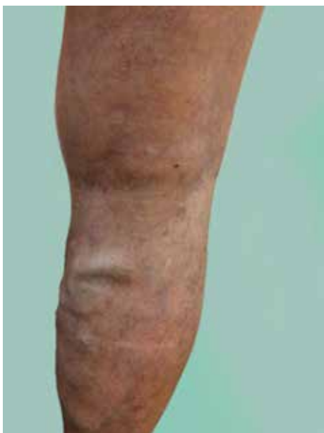
Obr. 2. Vena saphena parva – masivní varixy, pozdní záchyt

Zejména v mladém věku je žilní systém vybaven velkým množstvím žilních chlopní, které brání zpětnému toku krve v obou systémech i v jejich perforátorech. Tok krve v DK proti gravitaci umožňuje svalová pumpa za podpory fungujících žilních chlopní. Takto to funguje u zdravých žil. S věkem, dědičně, hormonálně a z příčiny různých