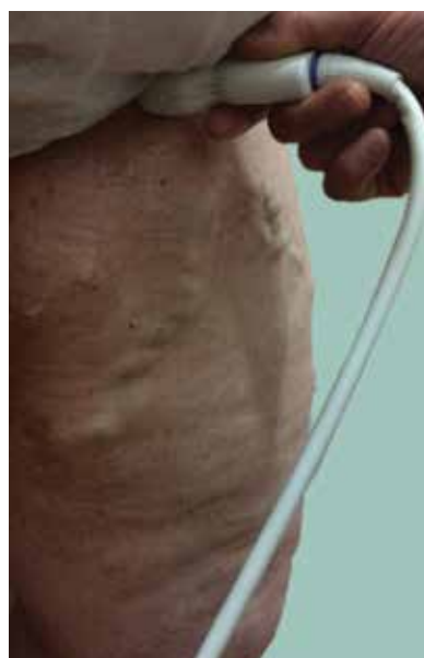
Obr. 3. Dopplerovská ultrasonografie vena saphena magna

Po zhodnocení lokálního nálezu odesíláme nemocného při potřebě k vyšetření duplexní sonografií. Sonografie je v diagnostických metodách nyní na prvním místě, jelikož invazivní flebografie se v podstatě neprovádí s výjimkou některých komplexních vaskulárních malformací. Dopplerovská ultrasonografie (obr. 3, 4) je hlavní a nedílnou součástí flebologické diagnostiky,