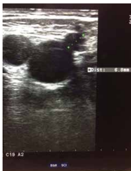
Obr. 4. Dopplerovská ultrasonografie vena saphena magna