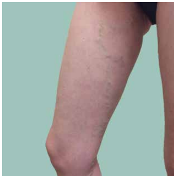
Obr. 1. Vena saphena magna varikózně rozšířená

VSP (obr. 2) je poněkud tenčí, lumen dosahuje zpravidla 3 mm. VSP též začíná na hřbetu nohy a přechází za fibulárním kotníkem na zadní plochu lýtka při zevní straně Achillovy šlachy a poté již přibližně v ose lýtka vedené mezi oběma hlavami m. gastrocnemius nad fascií. Zde je doprovázena nervus suralis . Opět přibírá řadu drobnějších větví z podkoží zadní a zevní plochy lýtka, variabilně i ze stehna. Je i zde vy-