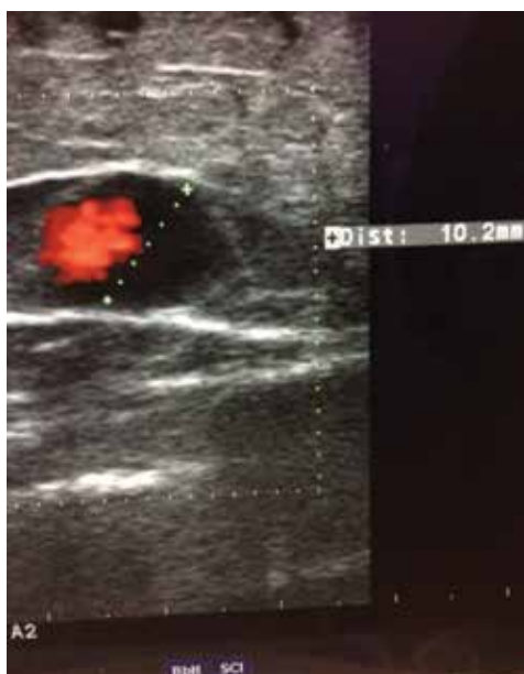
Obr. 5. Dopplerovská ultrasonografie vena saphena magna – Valsalvův fenomén a diametr žíly

zobrazí požadovanou část žilního řečiště na základě odrazu ultrazvukových vln na proudících erythrocytech, pomocí tohoto jevu diagnostikujeme patologický reflux krevního proudu v požadovaném žilním úseku. Čím větší je reflux (obr. 5) tím je CVI horší [23, 37,49].