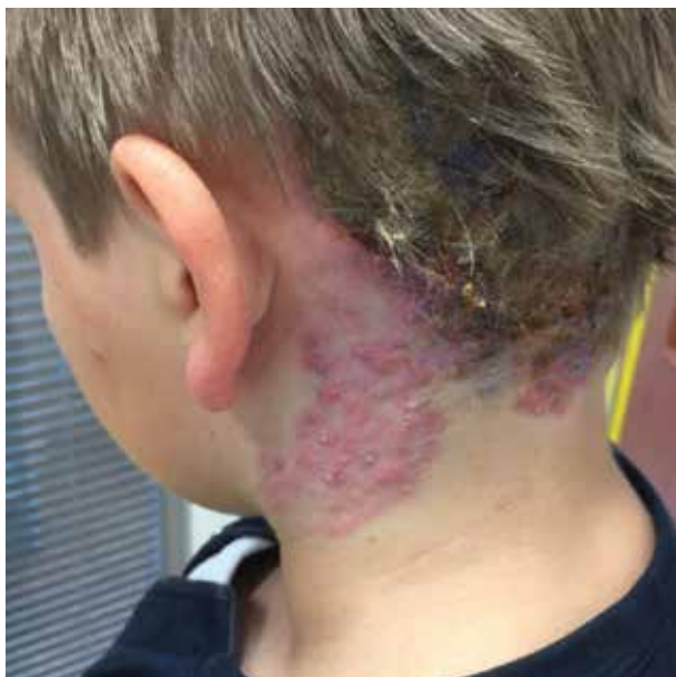
Obr. 1. Ložisko před léčbou