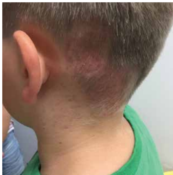
Obr. 3. Ložisko po 3 měsících léčby