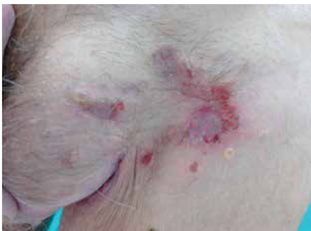
Obr. 1. Eroze s krustami a vezikulami na erytémové spodině