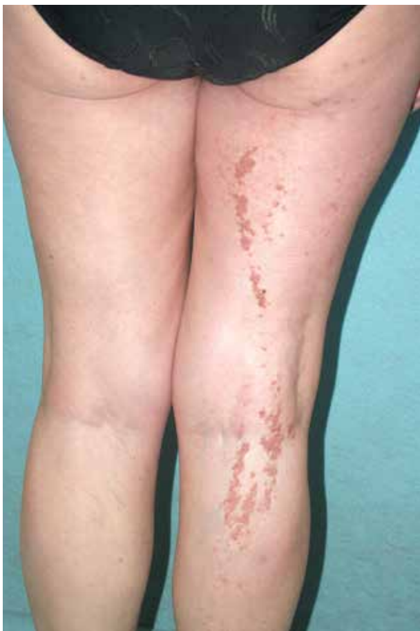
Obr. 6. Klinický obraz segmentálního postižení 1. typu

známy ze studií pigmentových onemocnění. Vzhledem k absenci ustáleného českého ekvivalentu jsou dále též uvedeny anglické originální názvy: