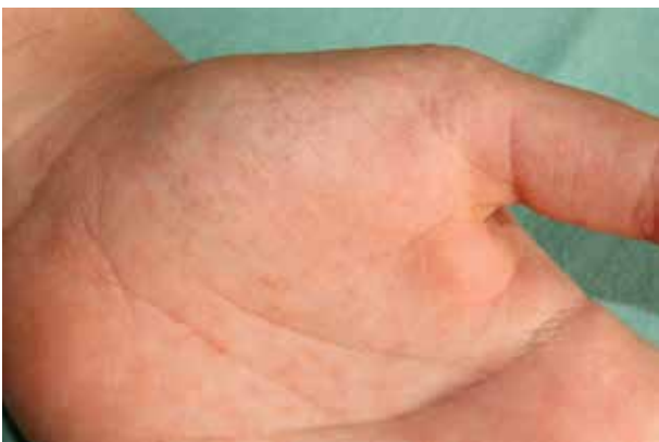
Obr. 4. Typický výsev drobných punktátních keratóz na kůži dlane

Charakteristické je postižení dlaní a plosek , které se vyskytuje až u 96 % nemocných. Na kůži tlustého typu rukou a nohou se tvoří punktátní keratózy ve formě mnohočetných jamek či papulek, které mohou přerušovat papilární linie (obr. 4). Tíže postižení dlaní převažuje nad postižením plosek. Vzácněji vznikají ostře ohraničená silná ložiska keratodermie v centrální části dlaní, na ploskách v místech nejvyšší tlaku s případným vznikem fisur [88]. V několika případech byl zaznamenán výskyt palmoplantárního postižení ve formě mnohočetných hyperortokeratotických filiformních („spiny“) hy-