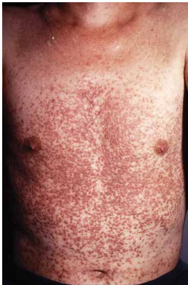
Obr. 1 a 2. Typický klinický obraz na trupu s výsevem nesčetných hyperkeratotických papul často splývajících v plochy

Často jsou postiženy axily, třísla, okolí anu a submamární oblast u žen, kde mají ložiska vyšší tendenci k mokvání a bakteriální kolonizaci. Ojedinele se především intertri-