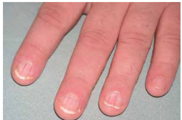
Obr. 5. Typické postižení nehtů rukou s podélnou erythro/leuconychií

Hlášen byl případ vzniku subunguálního spinocelulárního karcinomu s průkazem přítomnosti HPV typu 16 [30].