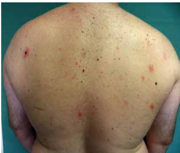
Obr. 1. Mucinosis follicularis