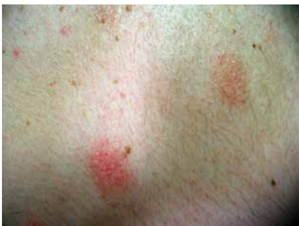
Obr. 2. Detail ložiska mucinosis follicularis

Závěr: folikulární mucinóza benigní subakutní formy, kdy přesvědčivé známky folikulotropní mycosis fungoides nejsou přítomny. Bylo doplněno podrobné laboratorní vyšetření. Kompletní biochemické vyšetření krve, C-reaktivní protein, hormony štítné žlázy, onkologické markery (CA 19-9, CEA, PSA, beta-2-mikroglobulin, alfa-1-fetoprotein) a antiborreliové protilátky byly negativní.