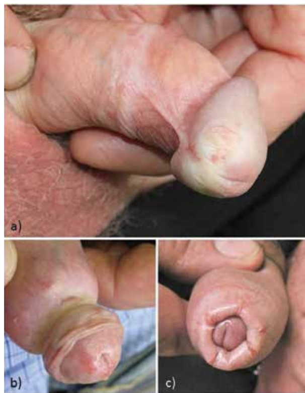
Obr. 5. Bělavě prosáklý glans se zřaseným povrchem, zkrácené frenulum, fibrotický cirkulární prstenec preputia (a), parařímóza fibrotickým prstencem (b), fimóza pro zúžení preputia s ragádami fragilního fibrotického preputia (c)

Prepubertálně nejčastějším příznakem onemocnění je pruritus, případně pálení, bolestivost, dysurie, konstipace, nejčastějším klinickým nálezem je hypopigmentace a atrofie kůže [2, 58]. Většina nemocných má postižení genitálu, vzácnější je postižení pouze extragenitální [2,9 %], případně současné postižení obou (2,8 %) [2]. Průměrná doba do diagnózy bývá udávána kolem 18 měsíců [2]. Nález jizevnatých změn a hemoragií může vést k podezření na pohlavní zneužívání, navíc jím LS může být vyprovokován či zhoršován v rámci Koebnerova fenoménu. Podezření podporuje nález u starších prepubertálních dívek, špatná odpověď na léčbu, výskyt pohlavně přenosného onemocnění [14, 42]. Někdy bývá popisován výskyt „infantilní perineální protruze“ u prepubertálních dívek v souvislosti s LS. Jedná se o jazykovitou kožní výchlípkou v perineálním raphe preanálně, která bývá častěji pozorována v sou-