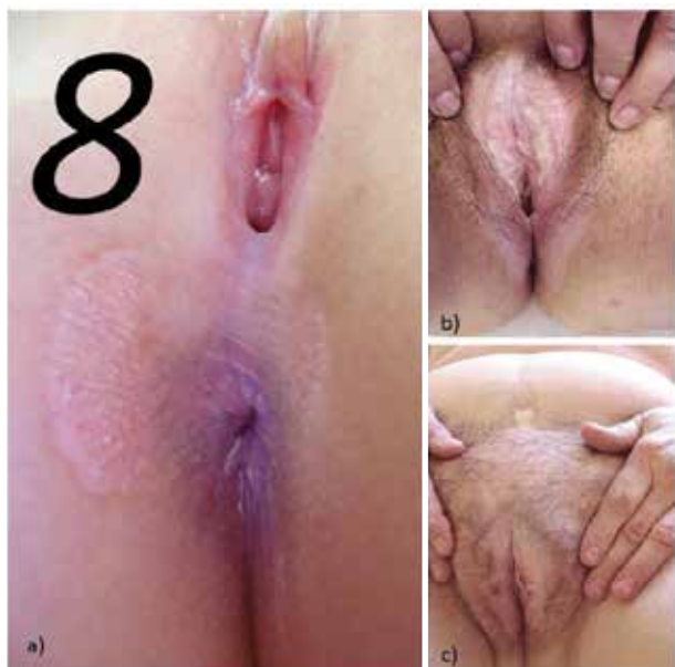
Obr. 4. Postižení perinea spojující postižení perianální a perivaginální připomíná číslici 8 (a), atrofie a jizvení labií s přechodem do třísel (b), postižení genitálu s hemoragiemi a Koebnerovým fenoménem v operační jizvě na břichu (c)

Onemocnění se objevuje asi u 9–23 % žen premenarcheálně, průměrného věku 54–76 let, u 41–17 % ve fertálním období, u 50–60 % žen postmenopauzálně, průměrného věku 55–60 let [10, 39]. Projevy se mohou vyskytovat pouze na malém okrsku kůže, mohou však zasahovat i rozsáhlé oblasti vulvy, perinea, partie perianální, třísel, intergluteální rýhy a okolí. Cirkulární postižení genitálu a perianální spojené postižením perinea svým uspořádáním připomíná číslici osm (obr. 4). Nejčastěji bývají postižena labia minora v 87 %, dále perineum v 85 %, clitoris v 72 % a perianální oblast v 50 % [53]. Extragenitální výskyt byl pozorován v 11–13 % [10, 39]. Na rozdíl od lichen planus projevy LS nepostihují sliznici vagíny a cervixu, pokud nedochází k vaginálnímu prolapsu a dlaždicové metaplazii chronicky drážděného epitelu [37, 63], může však dojít k postižení slizničního přechodu vestibula a k případnému zúžení introitu [42]. Onemocnění zpravidla začíná jako periklitoriální erytém, který se šíří na labia minora a dále. Fibróza, křehkost tkáně a silné svědění, často rušící spánek, vedou k snadné traumatizaci, tvorbě hemoragií, bolestivých prasklin dyspareunii až apaneurii, dysurii, případně obtížné defekaci. Jizvení může vést