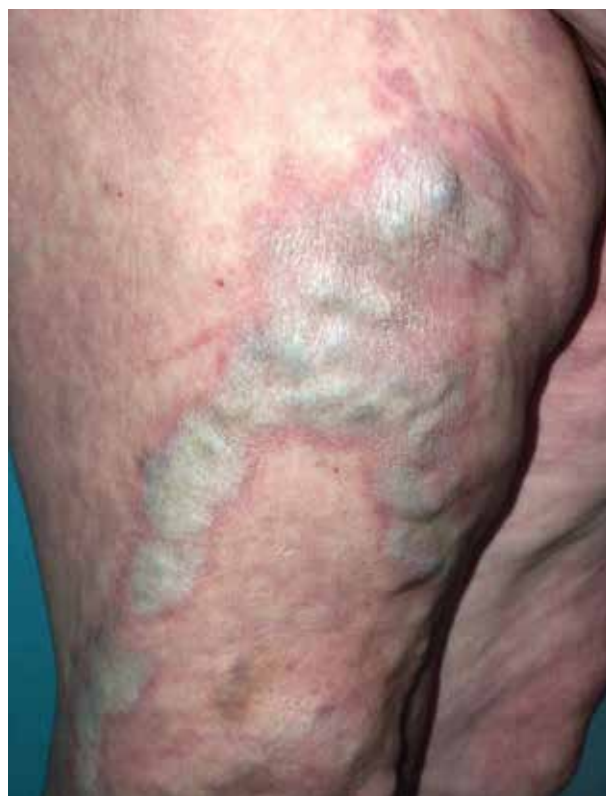
Obr. 2. Koebnerův fenomén – lichen sclerosus nad varikózními žilami