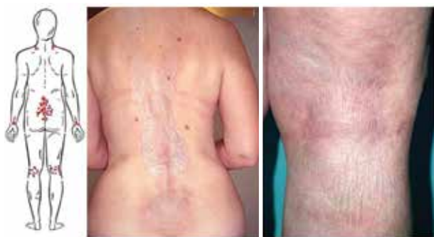
Obr. 7. Schéma predilekční lokalizace na zadní straně těla LS extragenitalis, bělavé lesklé zřasené plochy postihující oblast nad páteří s přechodem na postranní partie báze krku a popliteální jamky

cizi, která tak představuje ochranný faktor manifestace LS. Onemocnění se zpravidla projevuje jako šedobělavé makuly, papuly, někdy se zřaseným povrchem, hemoragiemi, postupně může přejít v tvorbu fibrózy, vedoucí ke křehkosti tkáně, purpuře, erozím, puchýřům. Nejčastěji, kolem 70 % případů, bývá postiženo preputium, kde často vzniká zužující se fibrotický prstenec, posléze fimóza, případně parafimóza (obr. 5). Často je postižen glans penis (60 %), méně je současně postiženo preputium i glans penis (40 %), v 17 % se nachází postižení meatu uretry, kde jizvení může vést ke zúžení i uretry, dysurii až obstrukci [12, 58]. Přes polovinu nemocných udává bolestivou erekci, či erektilní dysfunkci, kolem 18 % má urologické potíže, 29 % nemocných je asymptomatických [12].