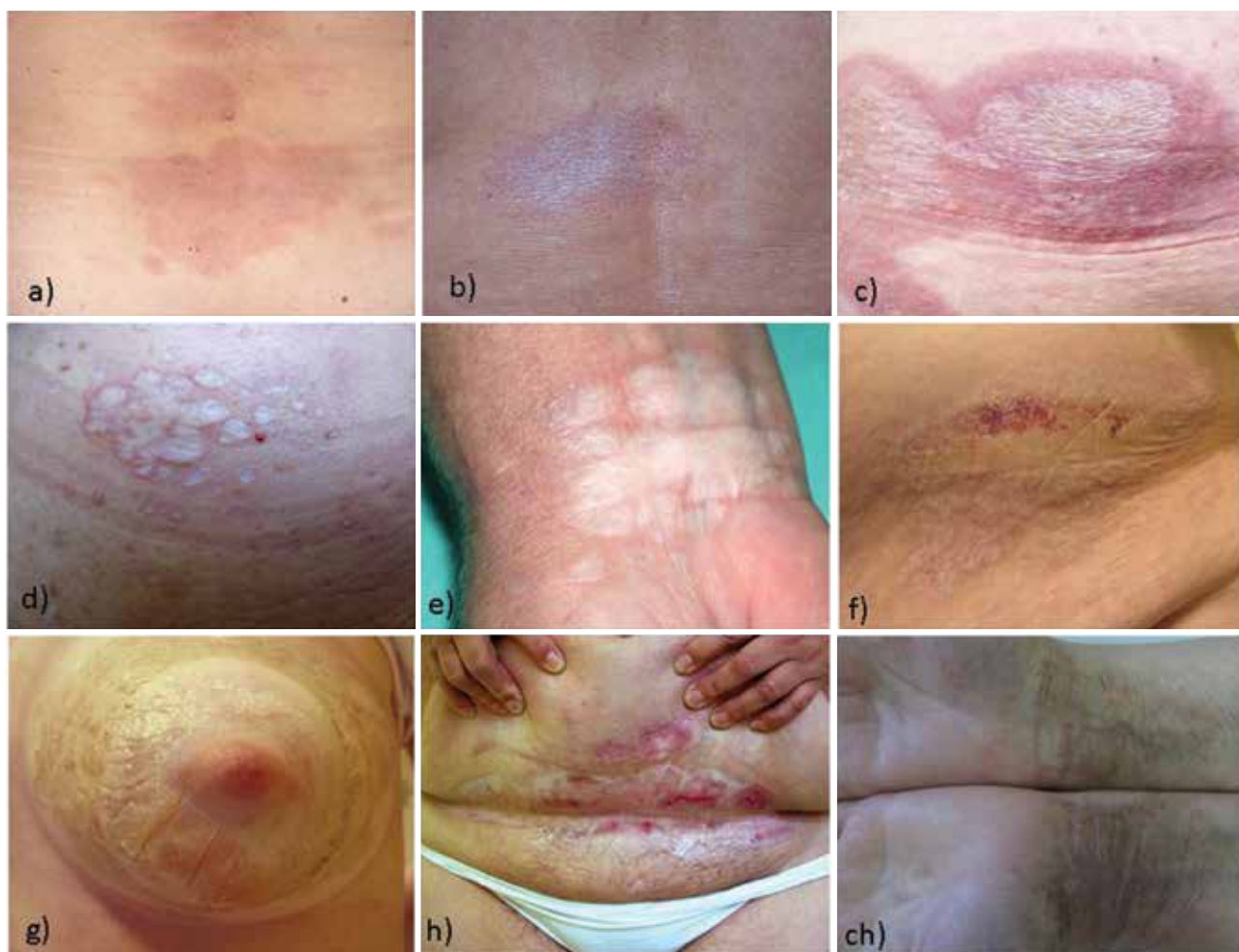
Obr. 3. Erytémy s naznačenými bělavými lesklými makulami (a), později jasně zřetelnými (b), splývajícími do ložisek se zřaseným povrchem (c), někdy s tvorbou bělavých papul splývajících do ložisek s drsným povrchem podmíněným bodovitými, folikulárně vázanými hyperkeratózami (d), (e), někdy až ploch s prosáklým povrchem s hemoragiemi (f), někdy s tvorbou bul (g), přecházejících do erozí (h), po ústupu jsou často patrné reziduální šedohnědavé pigmentace (ih)

Vzhledem k tomu, že LS vulvy postihuje zejména prepubertální dívky a peri- či postmenopauzální ženy, je možná role pohlavních hormonů. Výskyt LS též negativně koreloval s aplikací antikoncepce obsahující pouze progesteron [21]. Příznivý účinek lokální aplikace testosteronu, estrogenů, progesteronu, substituční hormonální léčby však nebyl prokázán [27].