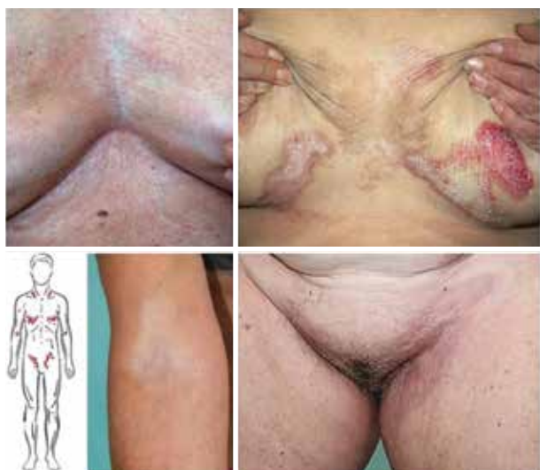
Obr. 6. Schéma predilekční lokalizace na přední straně těla LS extragenitalis, bělavé lesklé zřasené plochy sub- a intermamárně, v kubitách, rýze třísel a okolí, na hrudi přecházející až ve vyvýšená drsná bělavá ložiska s hemoragiemi, jinde přechází v reziduální hyperpigmentace

Onemocnění u dospělých nejčastěji vzniká v 3.–4. dekádě věku, asi u jedné třetiny s diagnózou stanovenou 2 roky od objevení prvních příznaků [12, 27]. Pouze 6 % pacientů při vzniku onemocnění jsou osoby po cirkum-