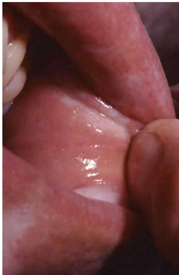
Obr. 8. Bělavé okrsky LS na ústní sliznici

Extragenitální forma LS představuje asi 6–20 % nemocných s LS u dětí je však vzácná [2, 28, 46]. Onemocnění často začíná jako erytematózní makuly, někdy