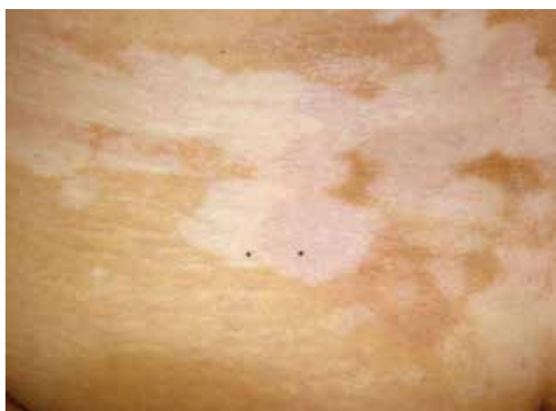
Obr. 1. Jasně bílé depigmentace vitiliga, v jejichž okolí a rozsahu jsou bělavě lesklé makuly až ložiska (černé body – levý v projevu vitiliga, pravý v ložisku lichen sclerosus)

Pro roli imunitního systému u žen svědčí pozorovaný společný výskyt LS s autoimunitními chorobami v 21,5 % případů, v rodinné anamnéze byly přítomné u 21 % a u 42 % byly nalezeny autoprotilátky (proti štítnici, gastrickým parietálním buňkám, hladkému svalu, mitochondriím, antinukleární). Nejčastěji byla pozorována autoimunitní thyreoiditis (12 %) dále alopecia areata, vitiligo, diabetes mellitus a perniciózní anémie [39] – obr. 1. U mužů je výskyt autoimunitních onemocnění výrazně nižší, často se neliší od normální populace, a proto vyšetřování z hlediska těchto onemocnění nebývá doporučováno [25]. U dětí byl pozorován výskyt asi u 1,5 % případů, takřka výlučně dívek (93 %), jednalo se zejména o vitiligo, morfeu, autoimunitní thyreoiditis, alopecia areata [2].