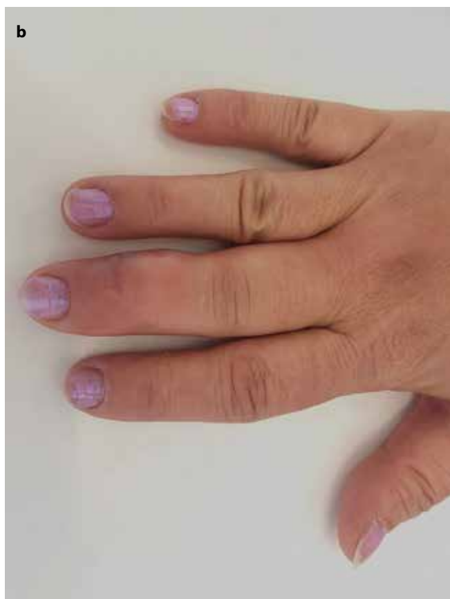
Obr. 1a,b. Vstupní vyšetření: a) pustuly, b) otok III. prstu pravé ruky