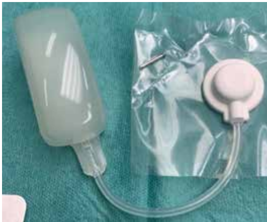
Obr. 5. Tkáňový expandér