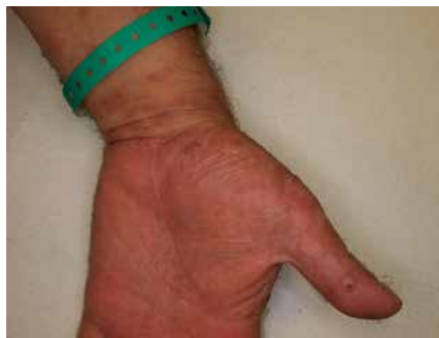
Obr. 1. Puchýře na dlaní u pacienta s bulózním pemfigoidem po očkování

Osobní anamnéza pacienta byla bez výraznějších pozoruhodností. Byl léčen pro arteriální hypertenzi,