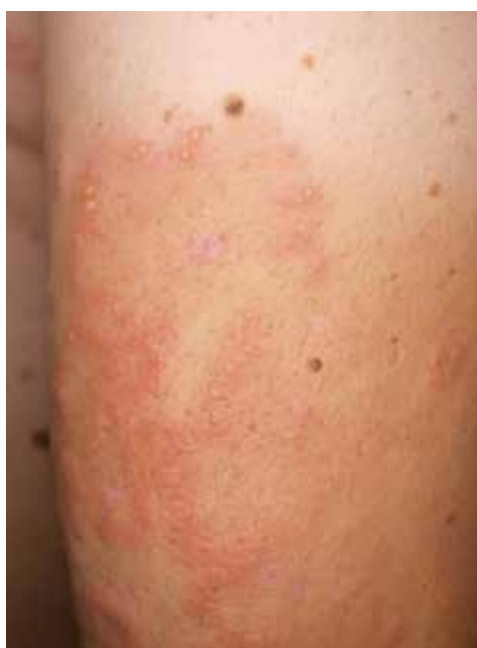
Obr. 3. Detail projevů s puchýřky v okrajích postižených ploch