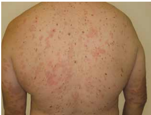
Obr. 2. Erytémová ložiska až urtikariálního vzhledu na trupu