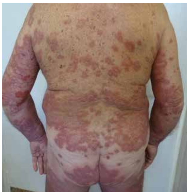
Obr. 6. Exacerbace dříve diagnostikovaného pemfigoidu po vakcinaci

Při této dávce nedocházelo k tvorbě puchýřů až do června 2021.