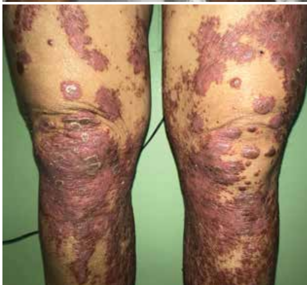
Obr. 1. Lokální nález při přijetí a) hyperkeratózy v oblasti plosek, b) exantém na rukou s postižením nehtů, c) lividní papulózní léze s deskvamací v oblasti dolních končetin

cerace s výrazným foetorem. Nehtové ploténky prstů nohou byly z větší části odloučené, na trupu a končetinách byly přítomny erytematoskvamózní papuly splývající do ložisek až ploch, místy vykazující Koebnerův fenomén (obr. 1a, b, c). Laboratorně byla v krevním obraze mírná neutrofilie bez leukocytózy. Základní biochemický screening byl bez větších patologií, pouze CRP po dobu hospitalizace kolísalo v rozmezí hodnot 40–118 mg/l (norma do 5 mg/l). Výše hodnoty tohoto markeru nebyla závislá na léčbě kortikosteroidy. Jednalo se o paraneoplastický projev při základním nádorovém onemocnění.