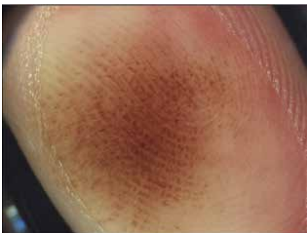
Obr. 8. Intrakorneální hemoragie Parallel-ridge like pattern – rezavě hnědá široká lineární pigmentace nad cristae superficiales. Vzniká po chronické traumatizaci.

Závěrem je možné konstatovat, že dermatoskopické vyšetření hraje u plochých pigmentovaných projevů