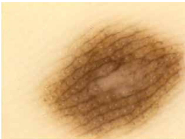
Obr. 1. Melanocytový névus „Parallel furrow pattern“ – paralelně probíhající tenká lineární pigmentace v sulci superficiales, viditelná akrosyringia.