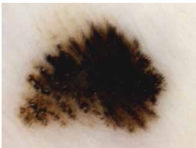
Obr. 2. Melanoma in situ „Parallel ridge pattern“ – paralelně probíhající široká lineární pigmentace nad cristae superficiales, nevidíme akrosyringia.