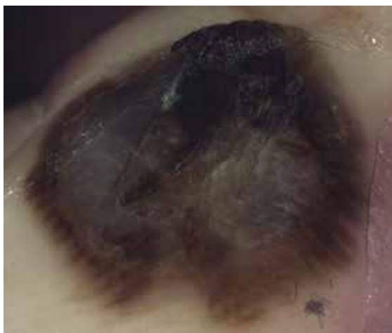
Obr. 7. Maligní melanom 1,1 mm s regresí Projev je větší než 1 cm v průměru, v centru bezstrukturní okrsky s difúzní šedomodrou nebo bělavou pigmentací, při okrajích široká lineární pigmentace nad cristae superficiales.

neum) pod mechanickým vlivem. Fibrilární pigmentace (především pravidelná) odpovídá ve většině případů melanocytovému névu, nevylučuje ale v ojedinělých případech (nepravidelné uspořádání) tenký maligní melanom (většinou melanoma in situ).