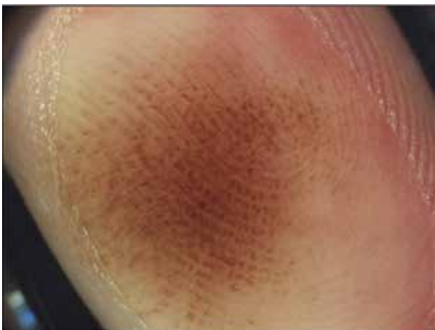
Obr. 8. Intrakorneální hemoragie Parallel-ridge like pattern – rezavě hnědá široká lineární pigmentace nad crista superficialis. Vzniká po chronické traumatizaci.

Závěrem je možné konstatovat, že dermatoskopické vyšetření hraje u plochých pigmentovaných projevů