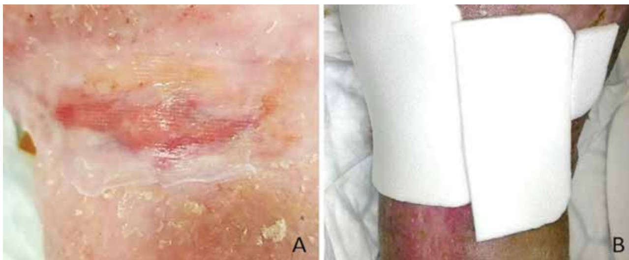
Obr. 3. Aplikace amniové membrány (AM) a sekundárního krytí na ránu A – aplikace AM na ránu s dostatečným přesahem, B – aplikace sekundárního krytí přes AM

Pacient sám, v nerušivém prostředí, označil stupeň bolesti a vyplnil dotazník kvality života (Wound-QoL) v češtině [25], ve kterém hodnotil retrospektivně svůj stav za posledních sedm dní. Stupeň bolesti rány zaznamenávali pacienti na číselné škále (Numeric rating scale, NRS) 1–10 bodů, přičemž za mírnou bolest byla