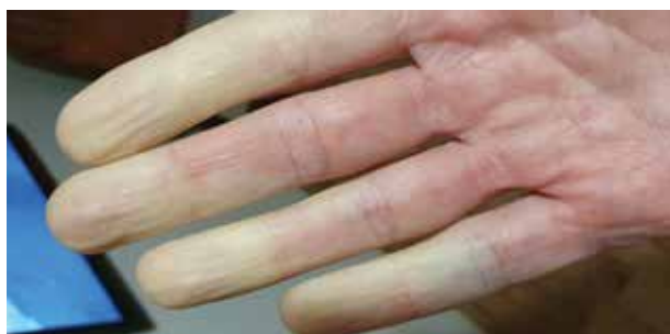
Obr. 1. Primární Raynaudův fenomén u mladé astenické ženy

Nejtypičtější manifestací RF je náhlá změna barvy aker . Nemusí být vždy a u všech nemocných vyjádřen