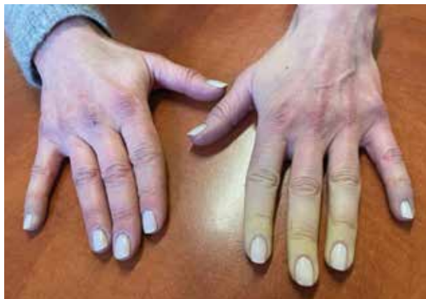
Obr. 2. Asymetrické zblednutí prstů levé ruky u 48leté nemocné s revmatoidní artritidou

Základem v přístupu k rozlišení primárního a sekundárního RF je tedy anamnéza pacienta, včetně profes-