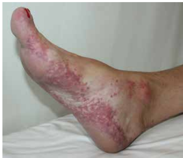
Obr. 3. Livedo racemosa plosky u pacientky s mnohočetným myelomem a kryoglobuliny I. typu

Rozlišujeme tři typy bílkovin, které jsou schopny chladové precipitace. Kryoglobuliny jsou imunoglobuliny, které jsou přítomny jak v séru, tak v plazmě a reverzibilně precipitují působením chladu. Kryofibrinogeny jsou fibrinogeny, které se srážejí v chladu, jsou spotřebovávány při koagulaci, a proto jsou detekovatelné pouze ve vzorcích plazmy. Chladové aglutininy (kryoaglutininy) jsou protilátky, které podporují aglutinaci červených krvinek při vystavení chladu. Všechny tři skupiny těchto bílkovin mohou způsobit okluzivní syndromy v kůži, které jsou spuštěny vystavením chladu [25]. Zatímco kryofibrinogeny a chladové aglutininy mohou být detekovány u mnoha pacientů v souvislosti s řadou onemocnění, jsou zřídka příčinou okluzivních syndromů souvisejících s vystavením chladu. Klinické syndromy způsobené přímo kryoprecipitací nebo kryoaglutinací nejsou časté. Kryoglobuliny mění svou konfiguraci v chladu a stávají se ve vodě nerozpustnými, což zvyšuje viskozitu krve a usnadňuje cévní okluzi. Kryoglobuliny