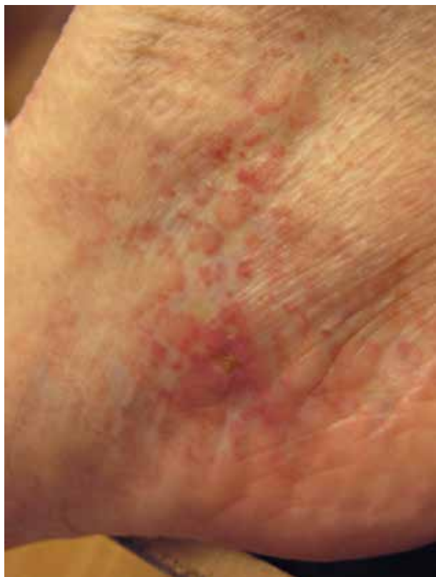
Obr. 6. Livedoidní vaskulopatie, obraz bílé atrofie (atrophia blanche) na mediálním kotníku

Tento syndrom byl poprvé popsán v roce 1965 s prevalencí asi 4 případy na milión obyvatel s dominantním postižením žen. Ačkoli je Sneddonův syndrom často