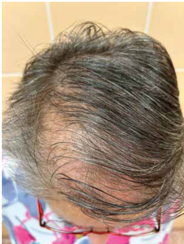
Obr. 3. Patientka FAGA I. stadia podle Ludwiga, léčba 100 mg verospironu denně Stav po pěti letech od začátku léčby (původní stav FAGA II. stadia dle Ludwiga).

Perorální cyproteron acetát (CPA) lze považovat za prevenci progresu FAGA u žen s klinickými nebo biochemickými známkami hyperandrogenismu. CPA je