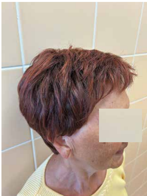
Obr. 4. Pacientka s FAGA v paruce

Někteří pacienti trpící AGA (zejména ženy) nadále využívají protetické pomůcky – paruky, příčesky a tupé. Jedná se o kamuflážní techniky „léčby“ AGA, na které pacienti spolupracují se zručným odborníkem ve vlásenkářství. Paruka je umělá pokrývka hlavy, skládající se z pletené sítě protkané přírodními nebo syntetickými vlákny . Paruky jsou rozdílné pro ženy a muže a dělíme je na účelové a módní. Účelové jsou