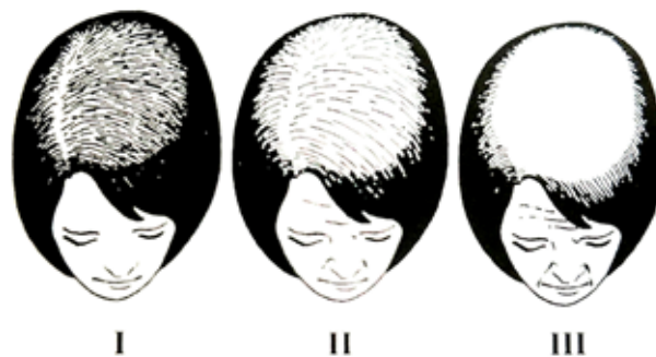
Obr. 2. Ludwigova klasifikace tíže FAGA [11]