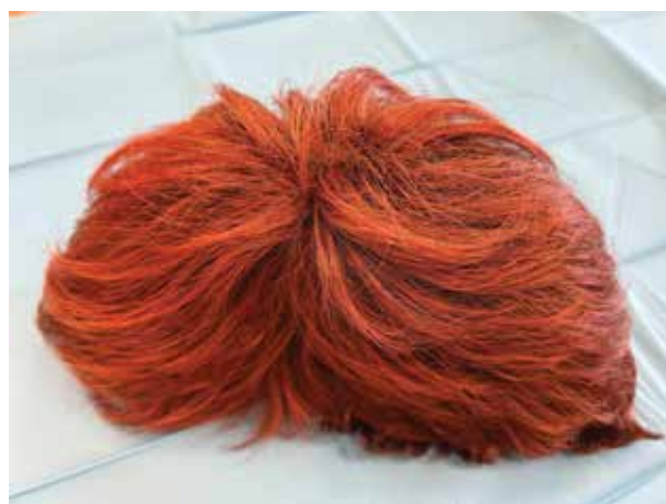
Obr. 5. Paruka – zevní strana

Paruky z pravých vlasů jsou na pohled i dotek nerozpoznatelné od vlastních vlasů a jejich životnost je ve srovnání se syntetickými parukami delší. Výhodou paruk z pravých vlasů je široká variabilita střihů a tvarů. Vlasy je možné tvarovat do různých účesů, kulmovat, foukat i upravovat barevný odstín. Tvar účesu je ale nutné obnovovat stejně často jako u vlastních vlasů. Příčesek se používá na normálních vlasových porostech ke zlepšení nebo vytvoření bohatší formy účesu. Velikost a tvar příčesků se řídí účelem, který má splnit. Tupé je pak pomůckou, která zakrývá částečnou nebo úplnou ztrátu vlasů na temeni hlavy (na rozdíl od paruky, která pokrývá celou hlavu). Samotné vlasy u pří-