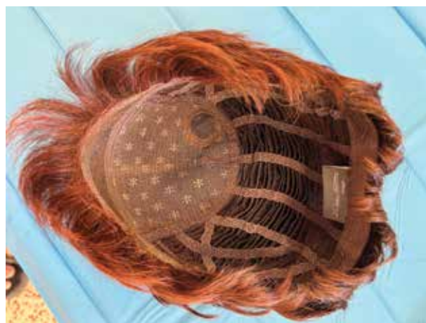
Obr. 6. Paruka – vnitřní strana s monturou