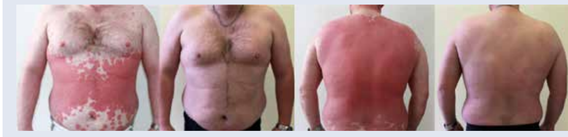
Obr. 2 | Pacient s metabolickým syndrómom s ťažkou formou psoriázy pred liečbou a po 3 mesiacoch liečby preparátom skupiny anti-TNF \alpha – adalimumabom